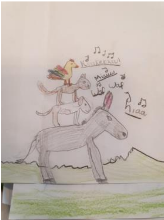
De Bremer Stadsmuzikanten

Als in de besluitvorming over een onderwerp geschillen binnen de medezeggenschapsraad (MR) ontstaan, regelen we dit volgens het reglement van de MR. Verschillen van mening tussen MR en bestuur lossen we op volgens de daarvoor geldende procedures, vastgelegd in de wet.