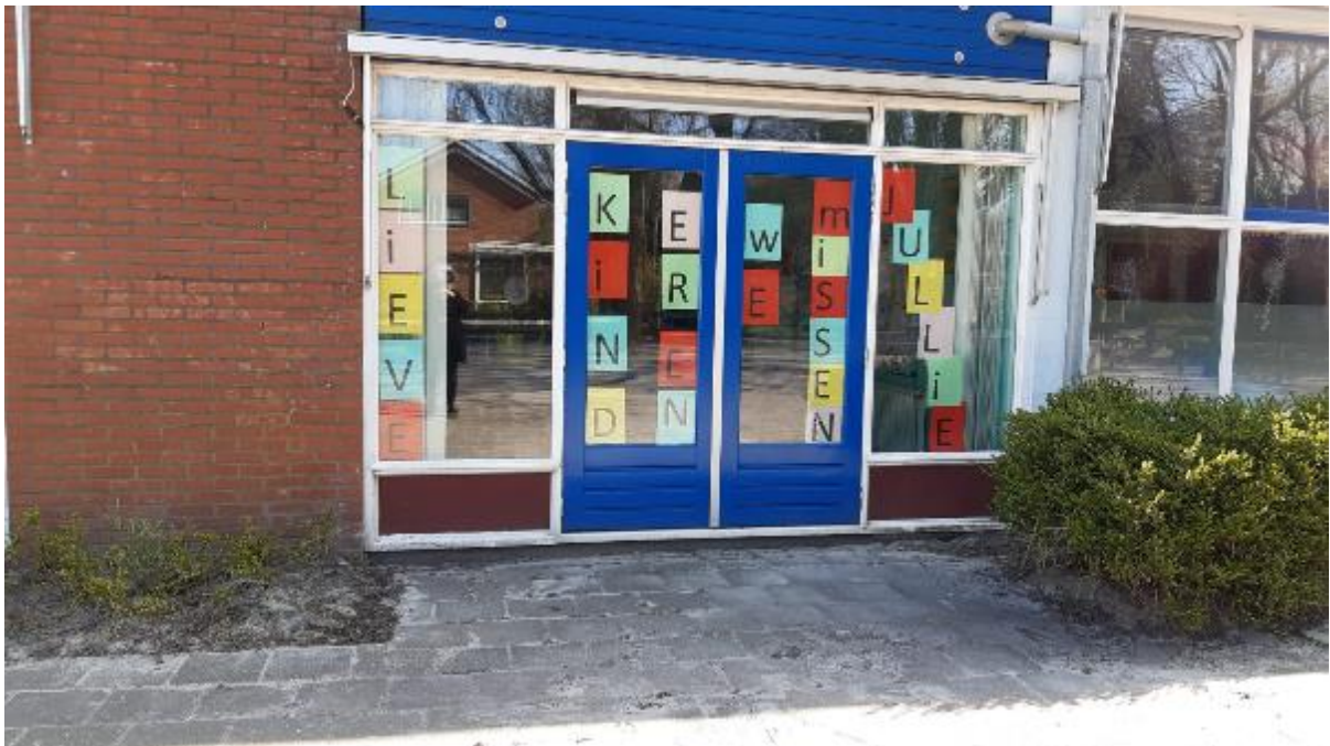
Schoolsluiting in coronatijd