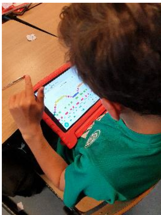
Programmeren in groep 8