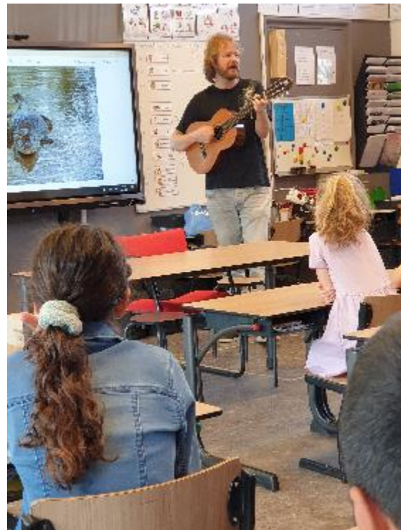
Muziekles in groep 6

school op basis van deze kenmerken aan resultaten zou moeten kunnen behalen. De schoolweging is een getal tussen 20 en 40. Hoe hoger de score, hoe lager de verwachte resultaten van de leerlingen en hoe meer belemmerende factoren. Hoe lager de score, hoe hoger de verwachte resultaten van de leerlingen en hoe meer bevorderende factoren. De gemiddelde schoolweging van de laatste drie jaren is voor de Oosterhoogebrugschool 28,34. Dit is een redelijk gemiddelde ten opzichte van andere scholen in Nederland.