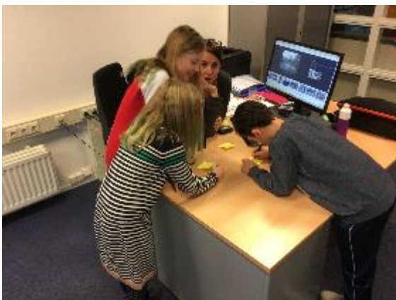
De Kinderraad overlegt met de directeur