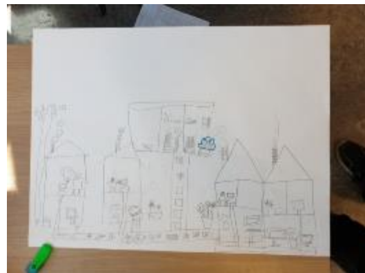
Zo werkt een computer, tekening groep 4

Voor meer- en hoogbegaafde leerlingen hebben wij een specifiek aanbod om hen uit te dagen en hun talenten te ontwikkelen. Zij kunnen één keer in de week naar de Plusgroep. We hebben een Plusgroep voor leerlingen uit groep 5 en 6 en een Plusgroep voor leerlingen uit groep 7 en 8.